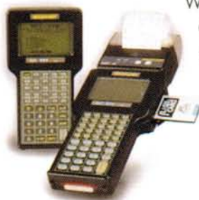
Φορητοί Καταχωρητές Νερού ή Αερίου

Η εφαρμογή των Περιφερειακών Γραφείων που τρέχει σε κανονικά pc, είναι ανεπτυγμένη από την εταιρία ΜΑΡΑΚ σε περιβάλλον Windows με το εργαλείο CA Visual Objects και περιλαμβάνει μία σειρά λειτουργιών με τις οποίες γίνεται εύκολα η διαχείριση και η επεξεργασία των στοιχείων που συλλέγονται καθημερινά.