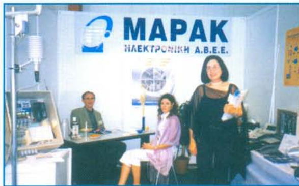
Το περίπτερο της εταιρίας στην Έκθεση «ΘΡΑΚΗ 2002»