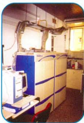
Τηλεπικοινωνιακό Σύστημα CORAL FLEXICOM 5000 (IP enabled) σε μια από τις εγκαταστάσεις του Πολυτεχνείου Κρήτης

Ανακείμενα του διαγωνισμού ήταν η προμήθεια και εγκατάσταση σύγχρονων τηλεπικοινωνιακών συστημάτων ISDN-IP enabled σε πέντε κόμβους (εντός και εκτός Πολυτεχνειούπολης), η υλοποίηση ενοποιημένου δικτύου βασισμένο σε διεθνές πρωτόκολλο QSIG, η εγκατάσταση παθητικού εξοπλισμού (οπτικές ίνες, καλώδια κ.λπ.) και η ανάπτυξη δικτυακών εφαρμογών Unified Messaging (ενοποίηση Voice/Fax/Email μηνυμάτων), κεντρική διαχείριση τηλεφωνικών χρεώσεων και συστημάτων,