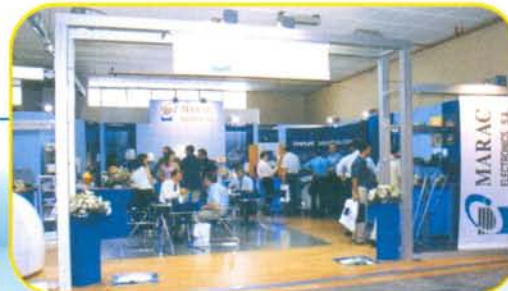
Άποψη από το περίπτερο της ΜΑΡΑΚ στα «ΠΟΣΕΙΔΩΝΙΑ 2002»