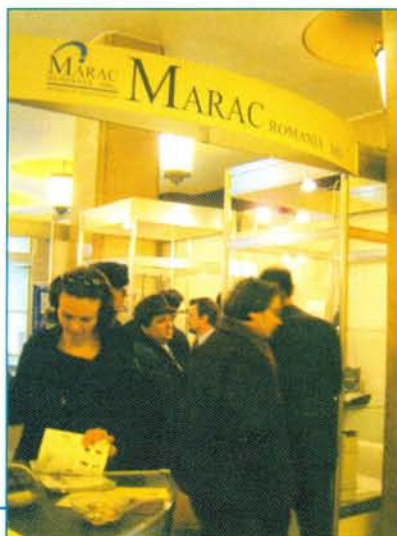
Το περίπτερο της MARAC ROMANIA SRL στην έκθεση RO COM TEL 2003

Στελέχη της ΜΑΡΑΚ πλαισιωμένα από προσωπικό της MARAC ROMANIA SRL είχαν την ευκαιρία να συναντήσουν σημαντικούς πελάτες της εταιρίας στη Ρουμανία και να επεκτείνουν τη δραστηριότητά της σε νέα προϊόντα υψηλής τεχνολογίας και σε νέες αγορές της αναπτυσσόμενης τοπικής οικονομίας.