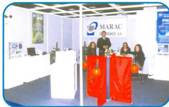
Το περίπτερο της ΜΑΡΑΚ στην έκθεση "HELECO '03"

100. Η ανάπτυξη και σχεδίασή του έχει γίνει από τη ΜΑΡΑΚ, η δε παραγωγή του γίνεται στο εργοστάσιο της εταιρίας στην Αλεξανδρούπολη. Μπορεί να χρησιμοποιηθεί σ' όλες τις εφαρμογές περιβάλλοντος (μετεωρολογία, υδρολογία, ωκεανογραφία κ.λπ.), παρέχοντας πλήθος ευκολιών στους χρήστες.