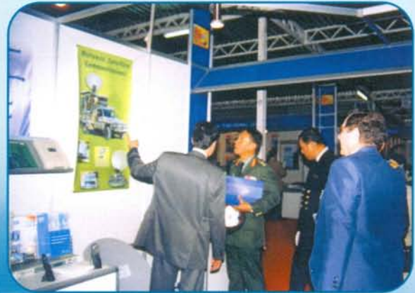
Από την κίνηση στο περίπτερο της ΜΑΡΑΚ