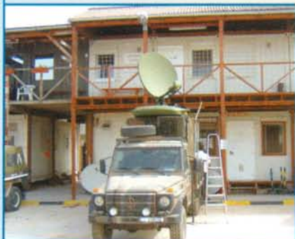
Κινητός Δορυφορικός Κλιβός σε Όχημα

Η ΜΑΡΑΚ εξόπλισε πρόσφατα το Σώμα Στρατονομίας των Ενόπλων Δυνάμεων στο Σεράγεβο Βοσνίας με Δορυφορικό Σύστημα VSAT. Είναι το δεύτερο σύστημα που προμηθεύονται οι Ένοπλες Δυνάμεις από τη ΜΑΡΑΚ. Το πρώτο σύστημα λειτουργεί ήδη απρόσκοπτα