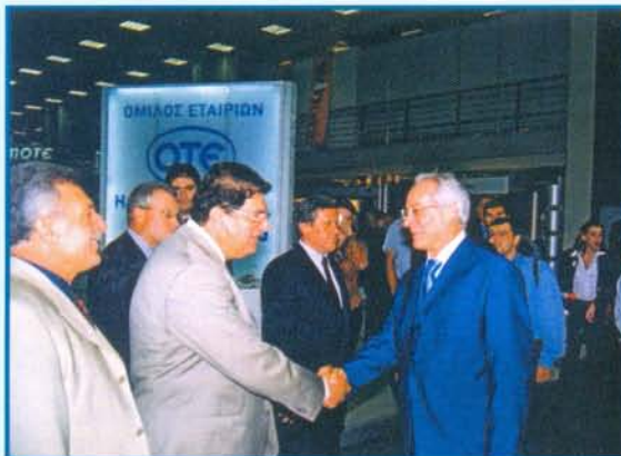
Στην Έκθεση EXPO COMM GREECE/BALKANS 2002, ο Υπουργός Μεταφορών και Επικοινωνιών κ. Χρ. Βερελής με τον Πρόεδρο της εταιρίας μας κ. Ν. Πιπιτσούλη

Ανάμεσα στα σύγχρονα συστήματα που εκτέθηκαν στο περίπτερο της ΜΑΡΑΚ περιλαμβάνονται συστήματα ασύρματης επικοινωνίας, ψηφιακής κινητής τηλεφωνίας, μετρήσεων και συγχρονισμού τηλεπικοινωνιακών δικτύων καθώς και δορυφορικά συστήματα INMARSAT, τηλεδιάσκεψης, ψηφιακής πολυπλεξίας, τηλεμετρίας κ.ά.