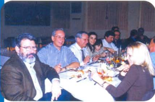
Στιγμιότυπο από τη συνάντηση των εργαζομένων της ΜΑΡΑΚ (Ιανουάριος 2003) στο Κρητικό κέντρο «ΜΑΔΑΡΕΣ»